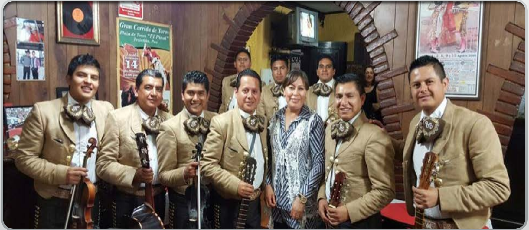
Reunión con el Mariachi Luz de Luna de Teziutlán