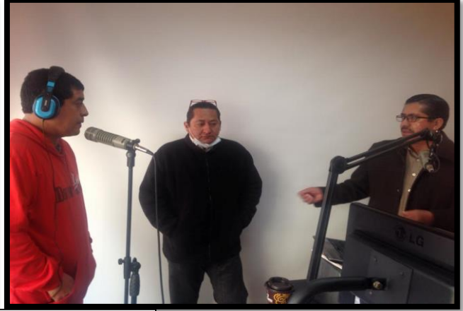
Entrevistas de radio de San Martín Texmelucan