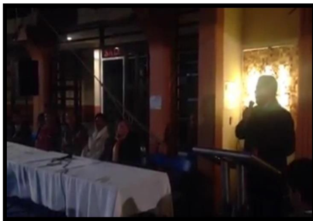
Inauguración de la segunda etapa de construcción en la Junta Auxiliar de San Rafael Tlanalapan