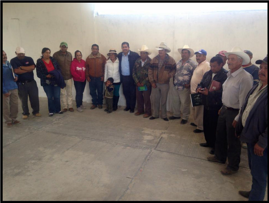
Reunión con beneficiarios del programa de árboles frutales del municipio de Santa Rita Tlahuapan