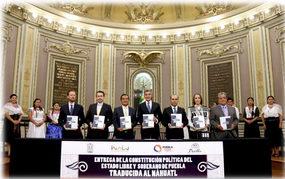
Entrega de la Constitución Política del Estado Libre y Soberano de Puebla Traducida al Náhuatl Agosto 24