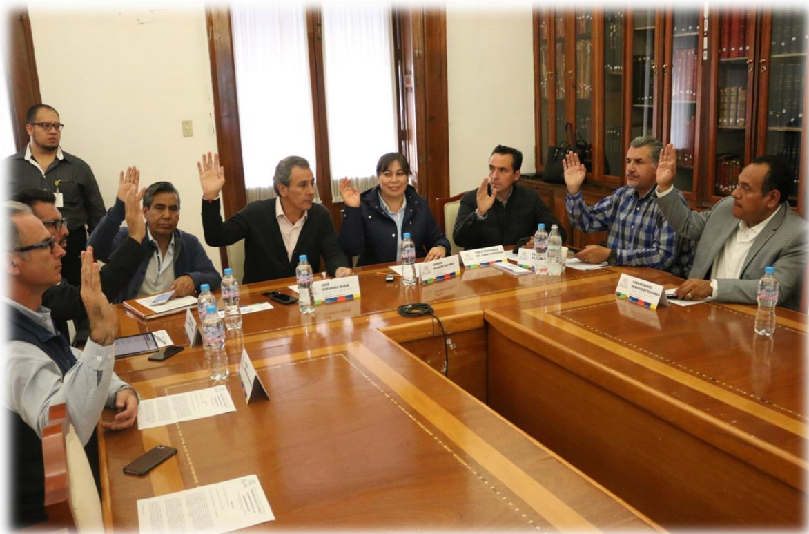
Comisiones Unidas de Hacienda y Patrimonio Municipal, y de Asuntos Municipales Septiembre 11