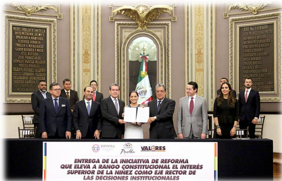
Iniciativa "Interés Superior de la Niñez" Agosto 23