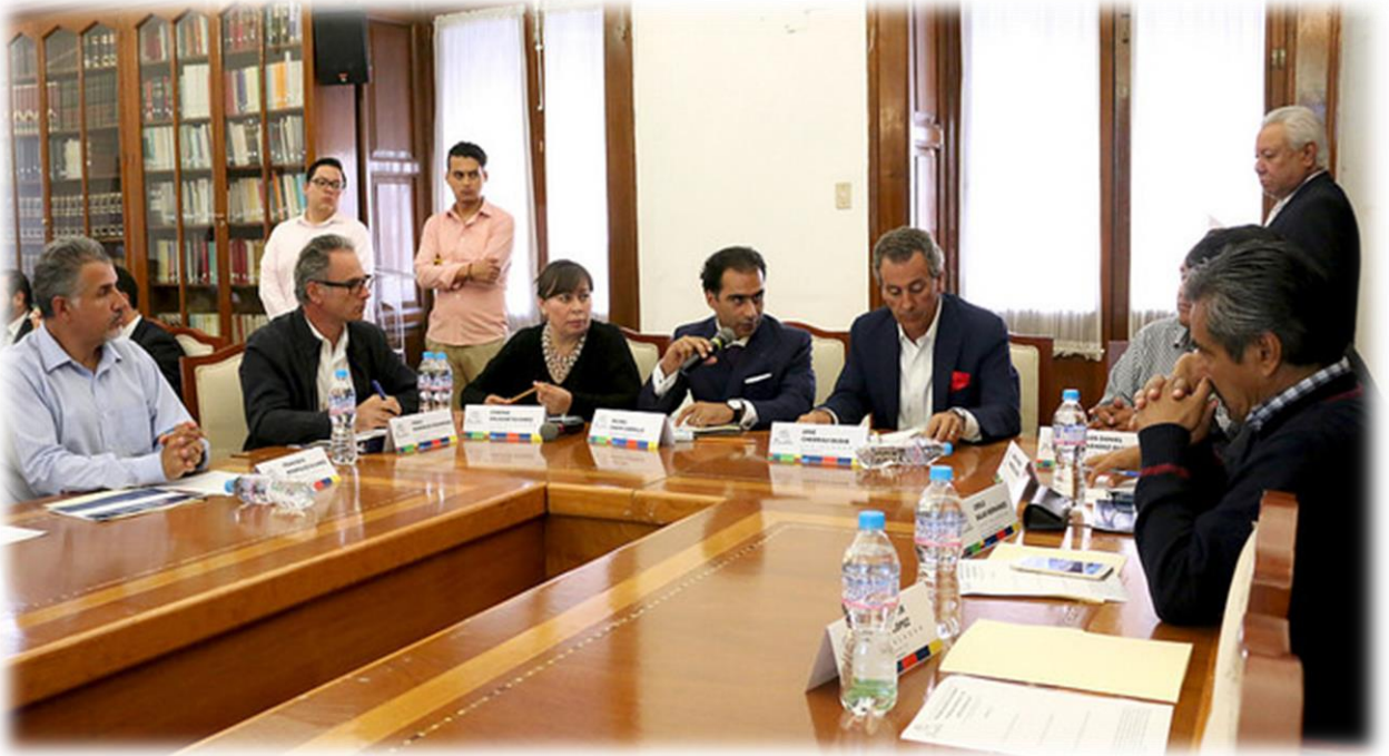
Comisiones Unidas de Hacienda y Patrimonio Municipal, y de Asuntos Municipales Agosto 28