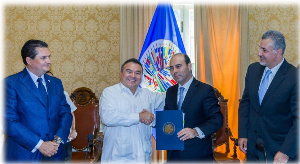
Firma de Convenio con la OEA Washington D.C. Agosto 21