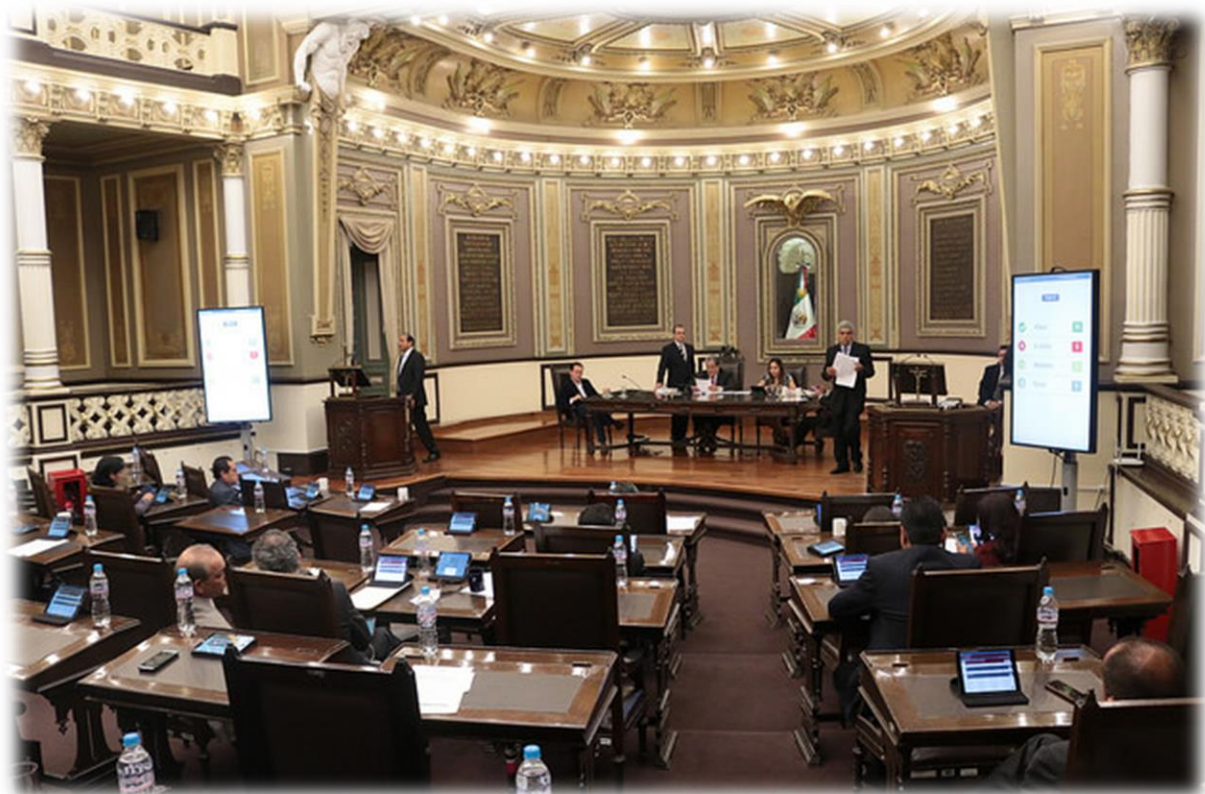
Sesión Extraordinaria Septiembre 13