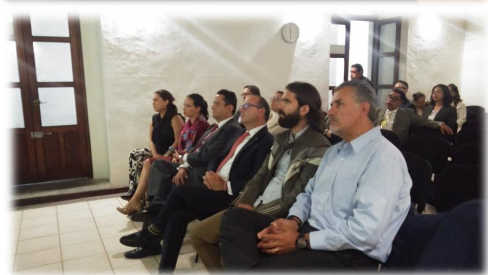
Reunión ITAIP Septiembre 14