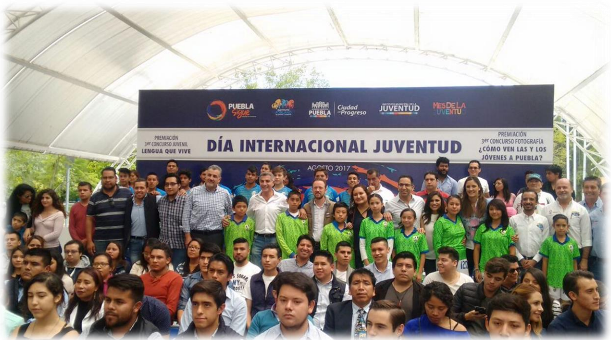
Día Internacional de la Juventud Agosto 12