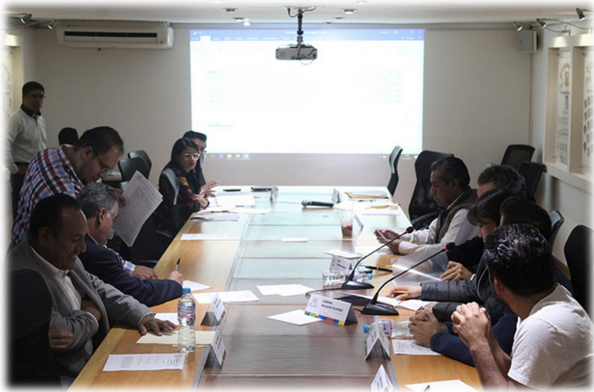
Comisiones Unidas de Hacienda y Patrimonio Municipal, y de Asuntos Municipales Octubre 13