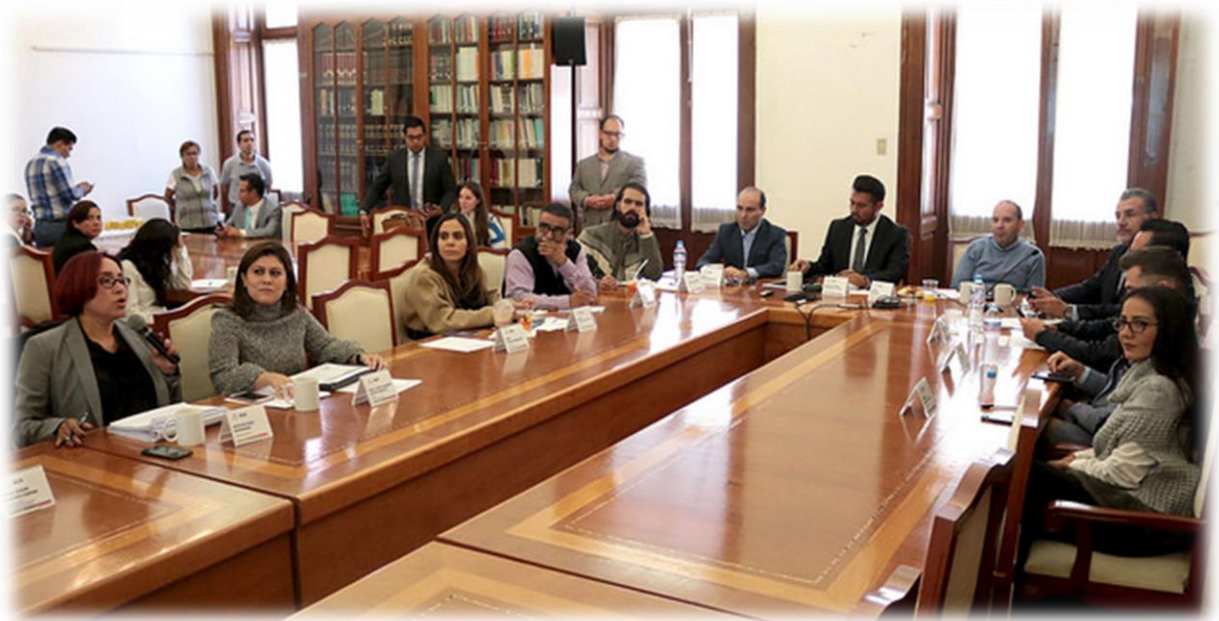
Comisiones Unidas de Transparencia y Acceso a la Información, y de Participación Ciudadana Septiembre 12