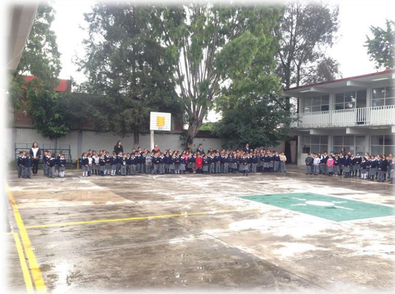
Entrega de Lentes Primaria Josefa Ortiz de Domínguez Septiembre 4