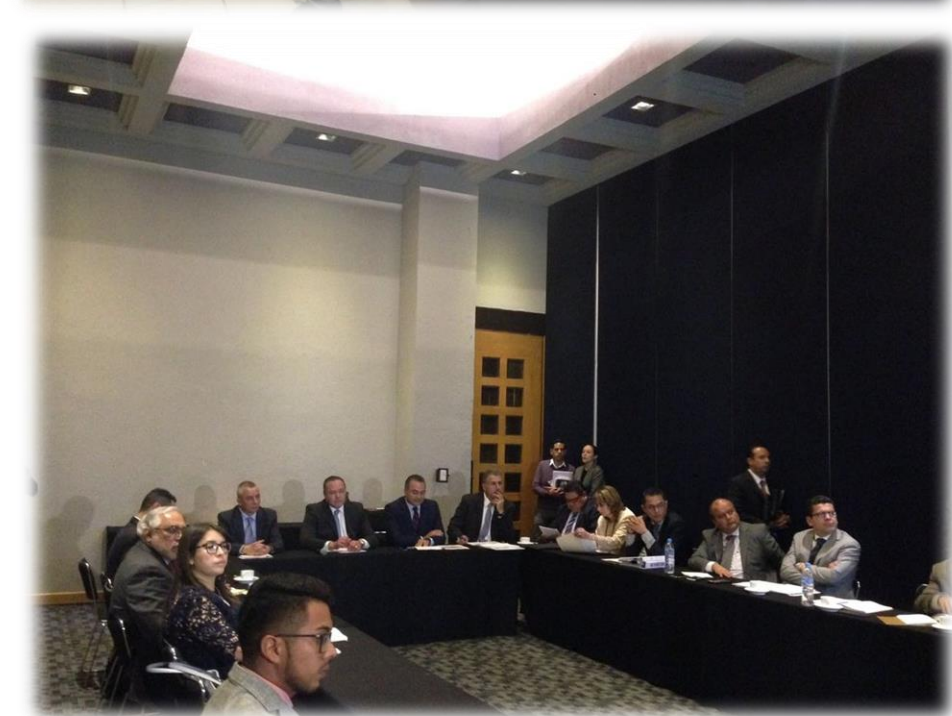
Reunión con representantes en México de la Oficina de las Naciones Unidas contra la Droga y el Delito Octubre 11