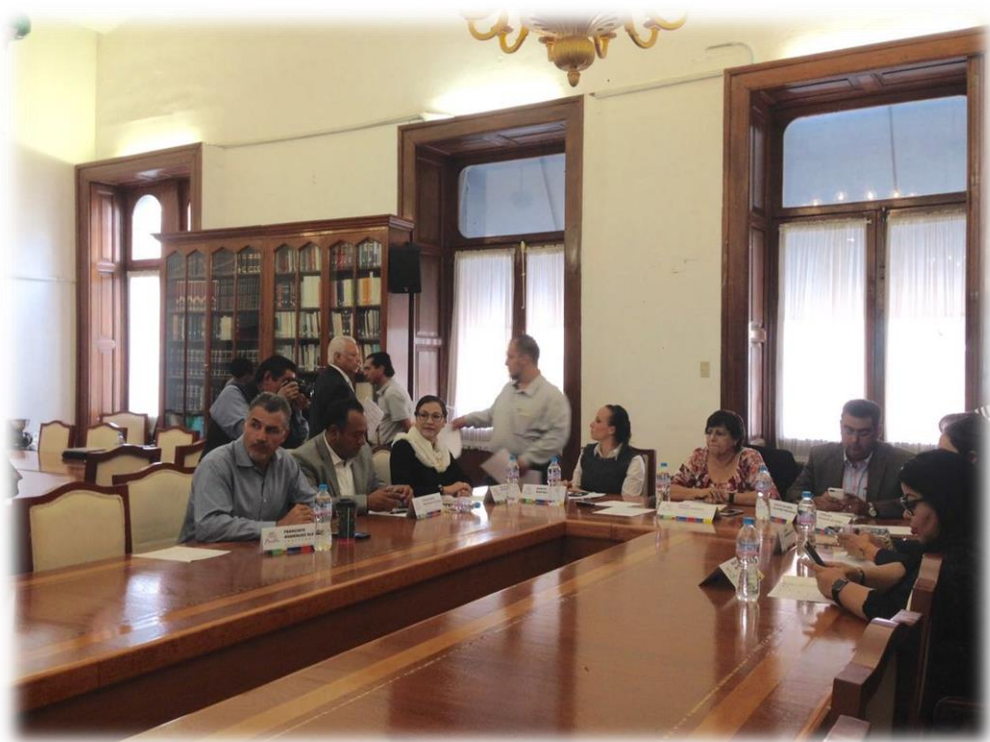
Comisiones Unidas de Procuración y Administración de Justicia, y de Igualdad de Género Septiembre 6