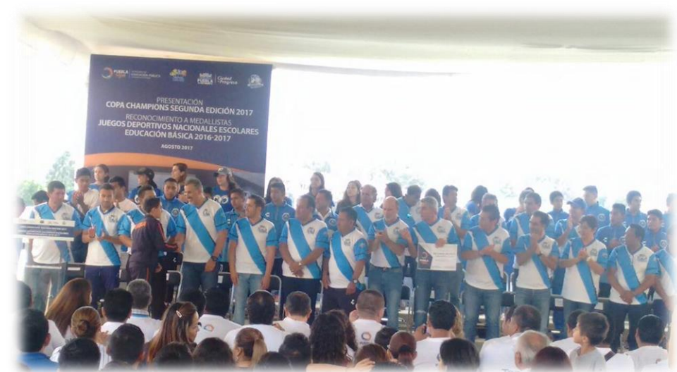
Lanzamiento de la Copa Champions Segunda Edición Agosto 26