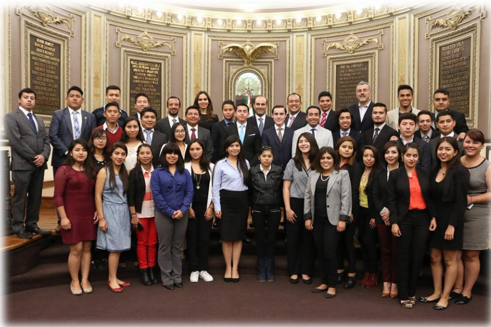
“Diputado por un Día”, integrantes de los Institutos Municipales de la Juventud Agosto 23