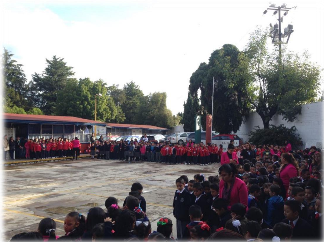
Entrega de Lentes Primaria Club de Leones Agosto 28