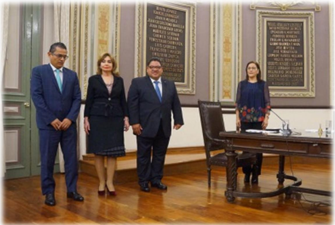
Sesión Extraordinaria Agosto 30