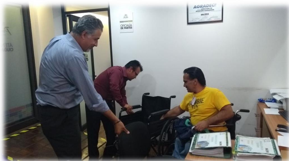
Entrega de Silla de Ruedas