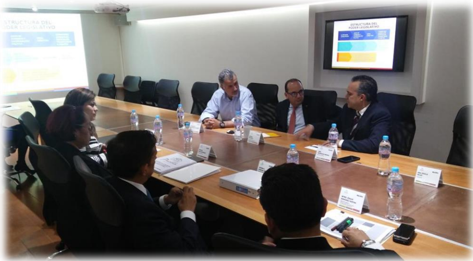
Reunión de áreas técnicas del Congreso del Estado Septiembre 13