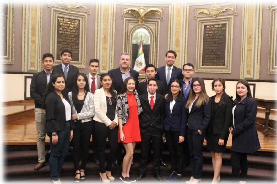
"Diputado por un Día" Alumnos de la Escuela Libre de Derecho de Puebla Octubre 13