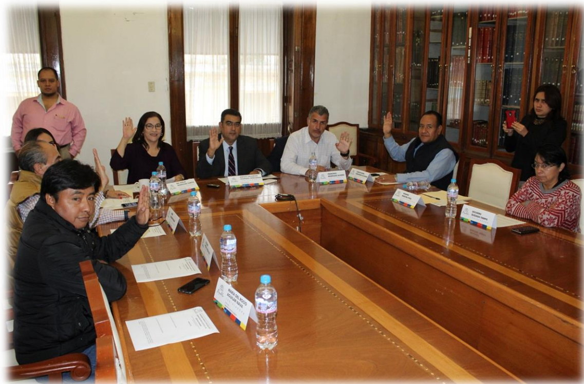
Comisiones Unidas de Procuración y Administración de Justicia, y de Derechos Humanos Septiembre 5