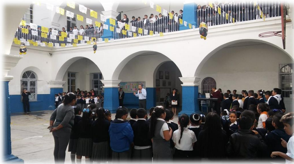
Ceremonia Primaria Himno Nacional Agosto 28