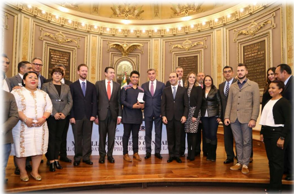
Entrega de Medalla "Congreso con Valores" Octubre 12