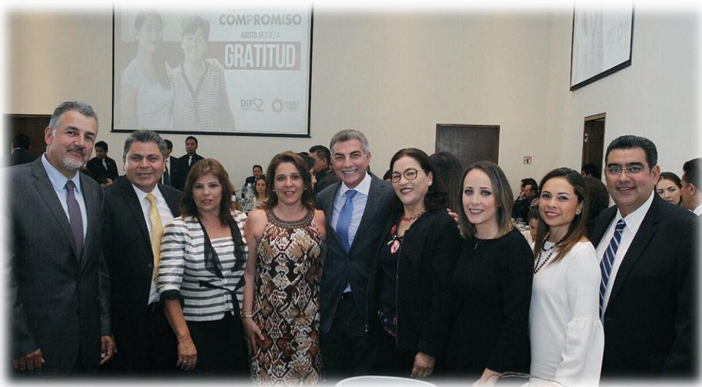
Beca a un Niño Indígena Agosto 19