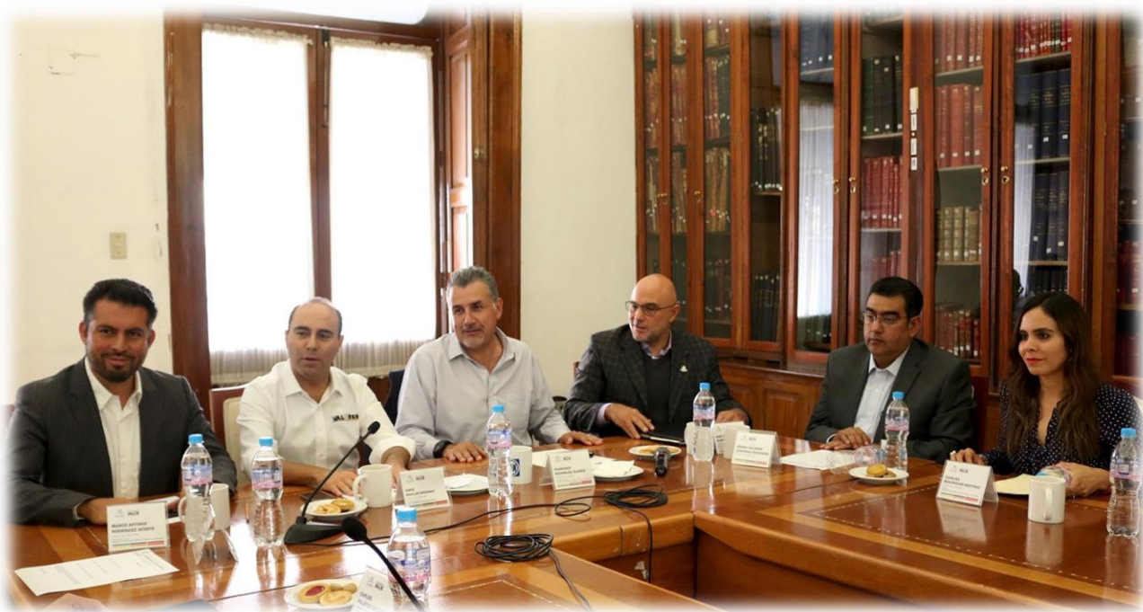
Comisión de Participación Ciudadana Septiembre 7