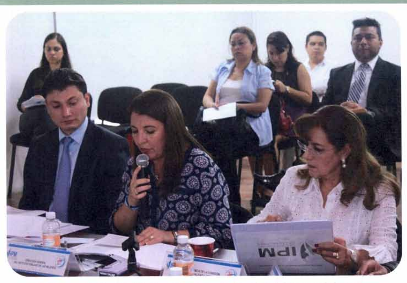
Segunda Sesión Ordinaria de la Junta de Gobierno del IPM