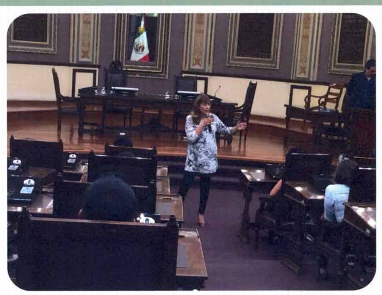
Diputado por un Día