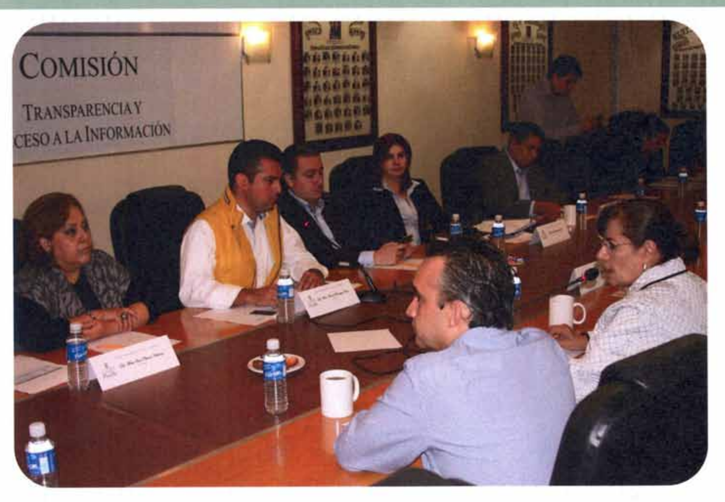
Reunión de la Comisión de Transparencia y Acceso a la Información