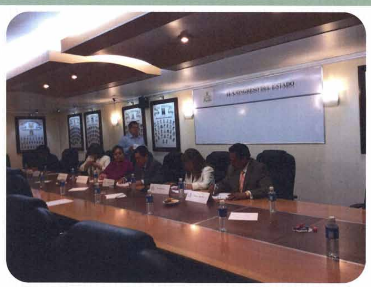
Reunión de la Comisión de Innovación y Tecnología