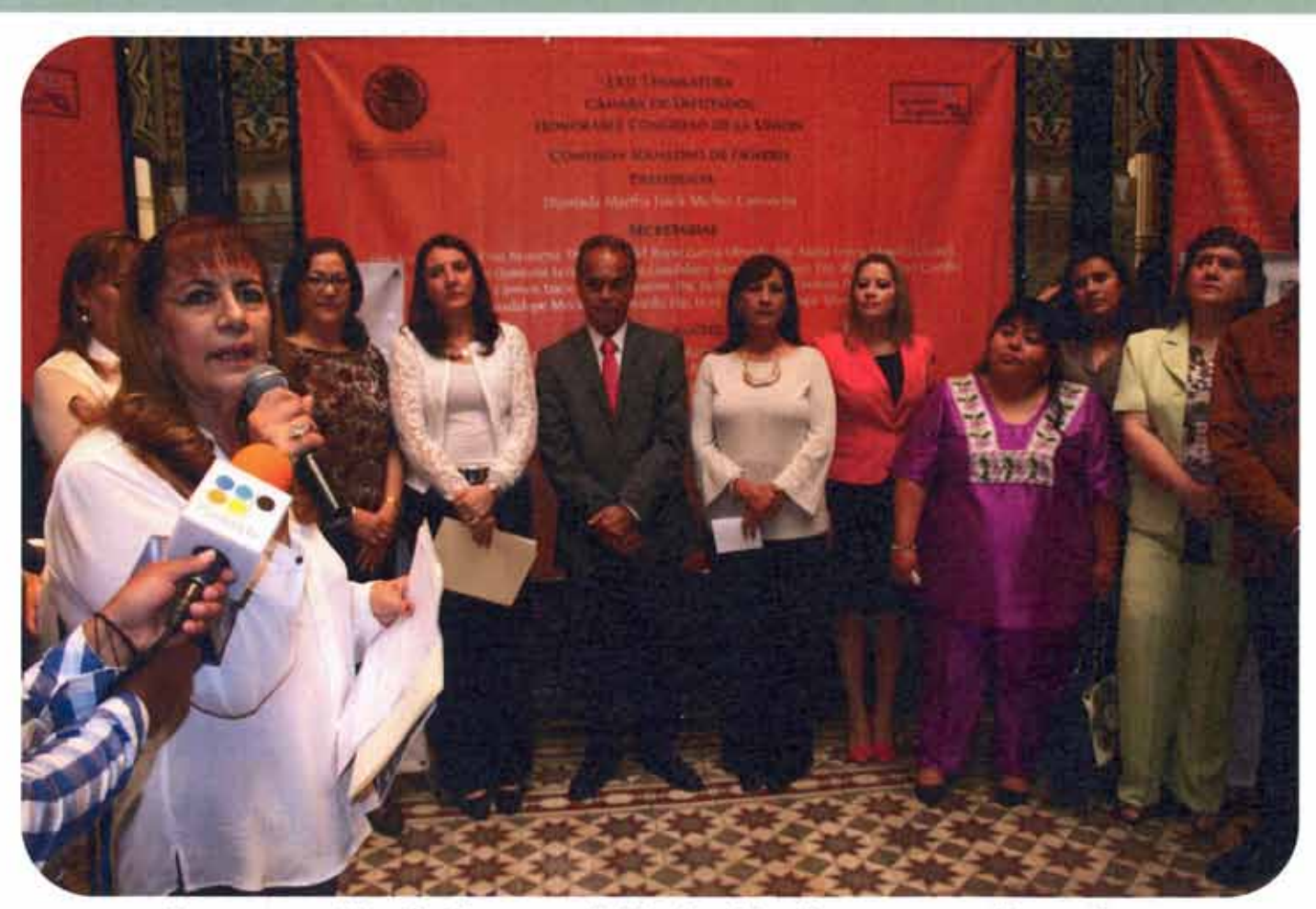
Inauguración de la exposición La Mexicana y sus Derechos