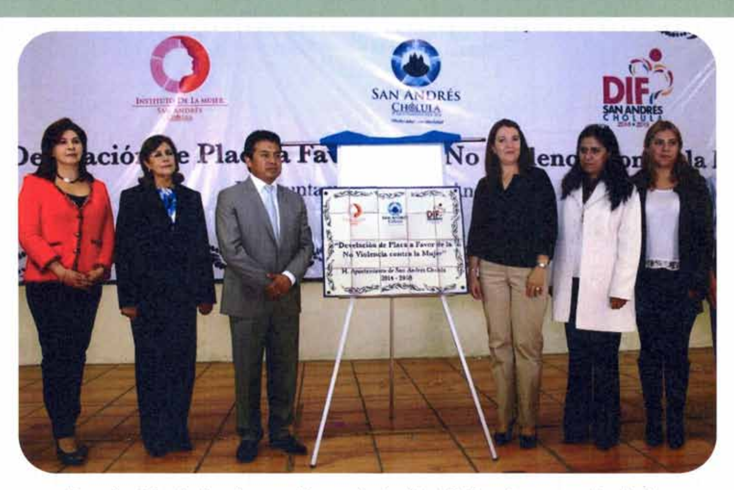
Develación de la placa a favor de la No Violencia contra la Mujer