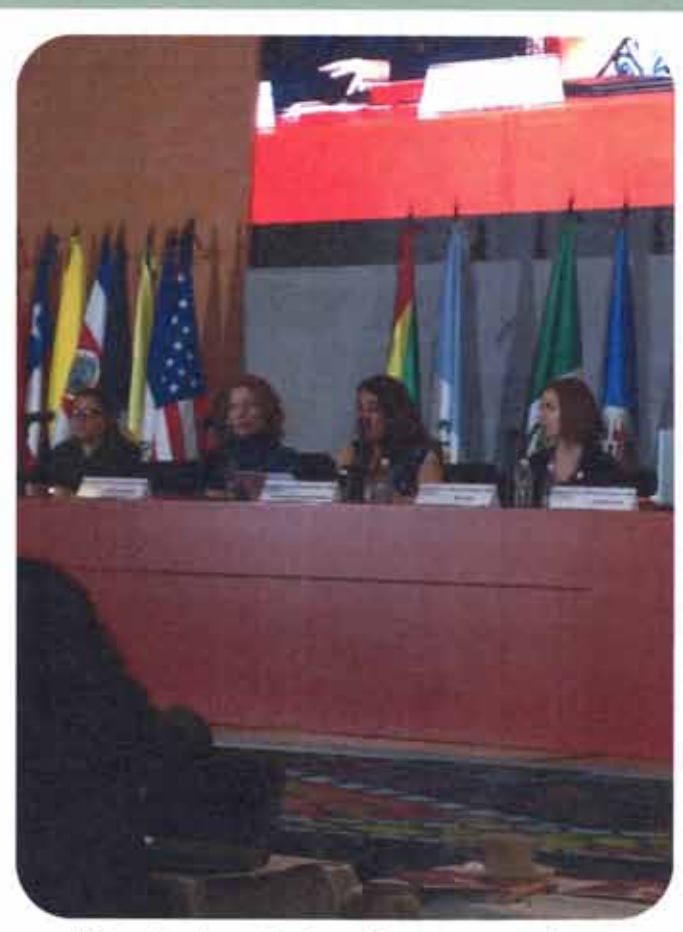
Foro Hemisférico Convención de Belém do Pará y la prevención de la violencia contra las mujeres: Buenas prácticas y propuestas a futuro