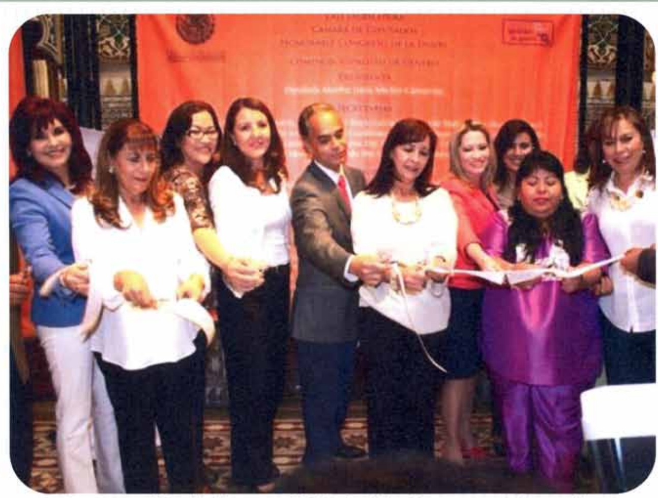
Inauguración de la exposición La Mexicana y sus Derechos