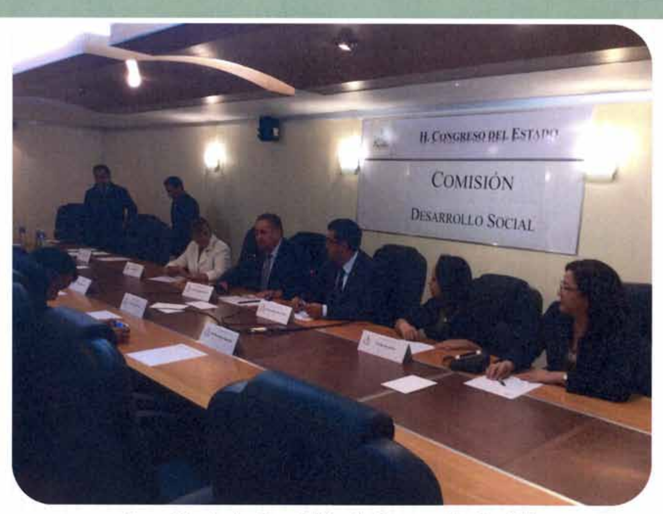
Reunión de la Comisión de Desarrollo Social