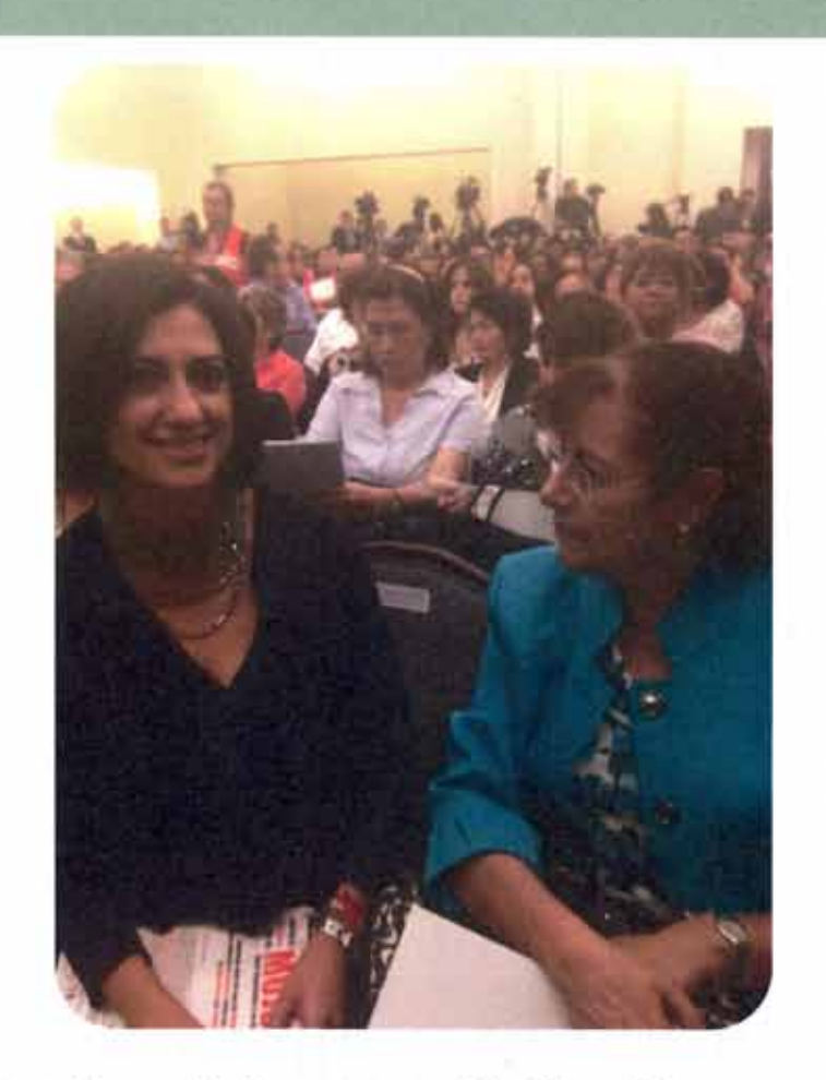
Foro "La Mujer emprendedora y el nuevo Régimen de Incorporación Fiscal"