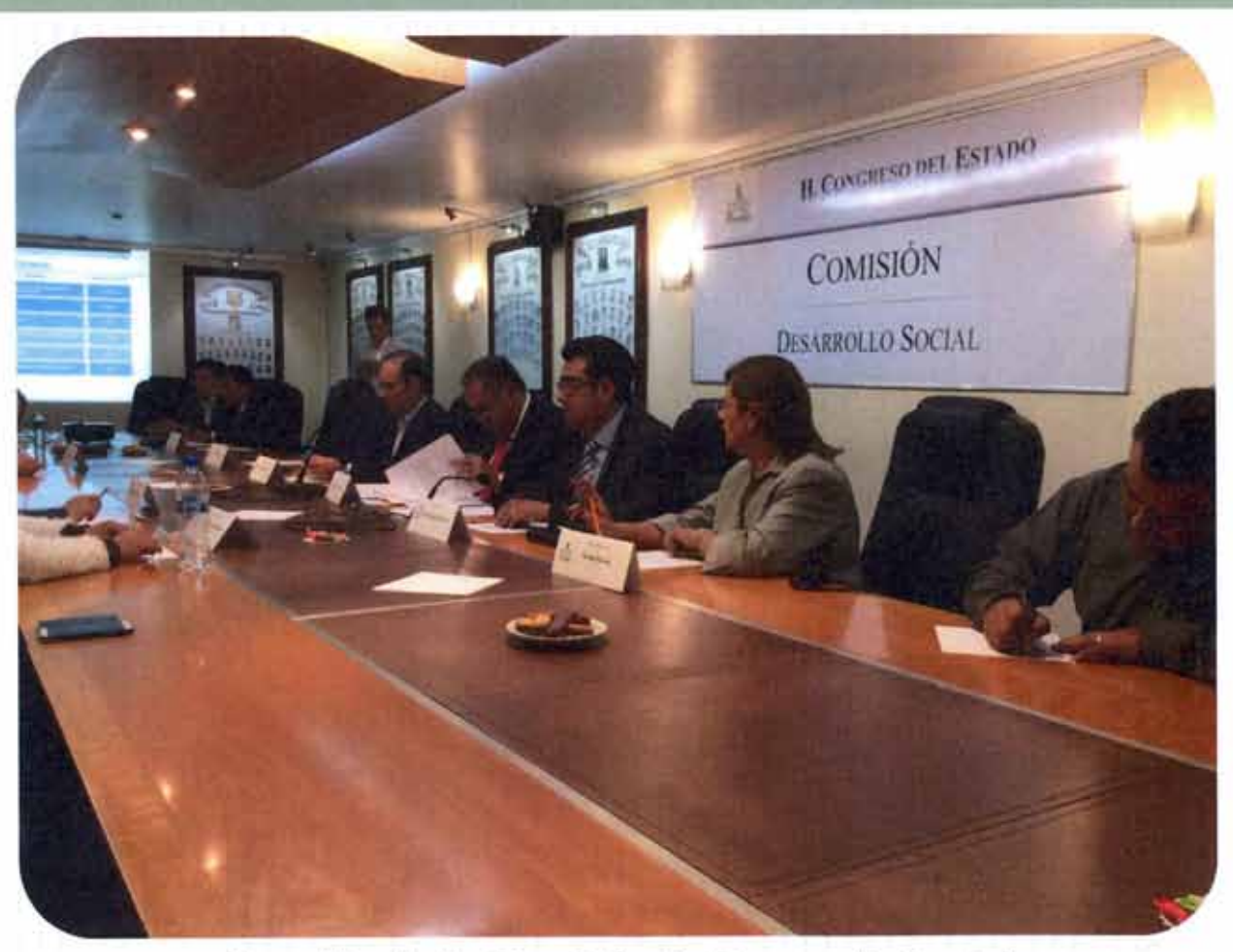
Reunión de la Comisión de Desarrollo Social