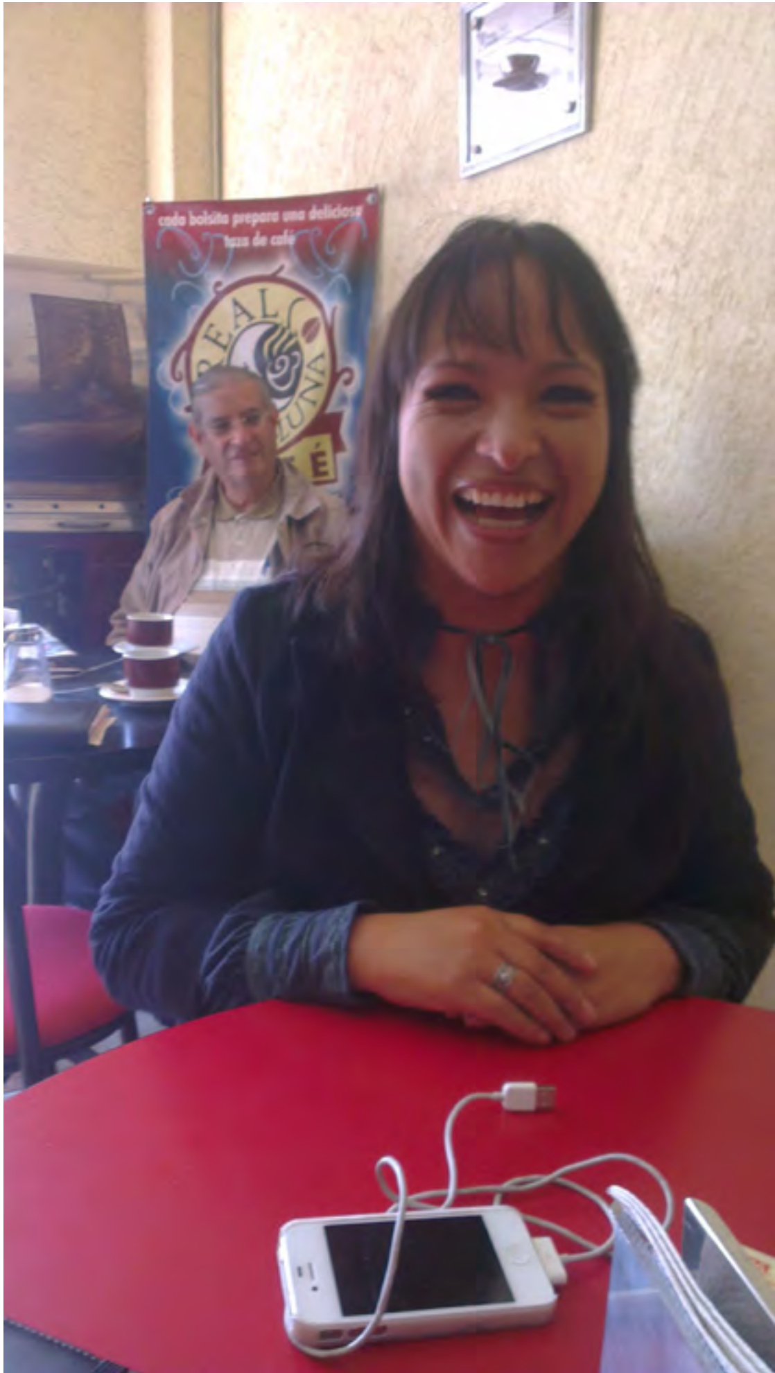
por Lizeth Sánchez García Librería de Visitas al 7º Dto