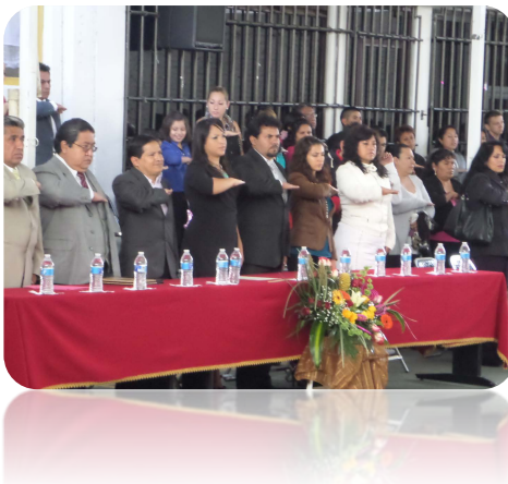
Realizando honores al Lábaro Patrio

“Ley de Educación del Estado de Puebla”.