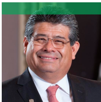
Dip. Javier Casique Zárate Presidente