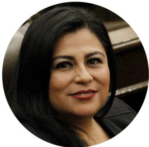
CRISTINA TELLO ROSAS DIPUTADA LOCAL

Quiero dirigirme a todos ustedes, con motivo de presentar el primer informe anual de mis actividades legislativas del periodo 2018-2019, el objetivo es darles a conocer los logros que se consiguieron en materia de políticas públicas en mi calidad de Diputada Local en la LX Legislatura del Honorable Congreso del Estado de Puebla.